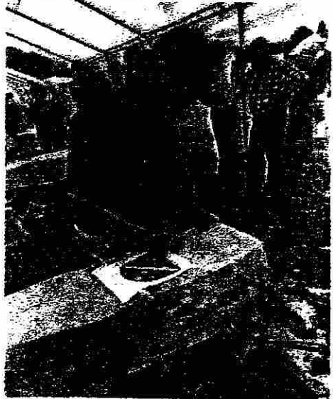
z kroniky kam na pouťové nástrahy a další zprávy