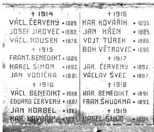
Památník padlým z první světové války ze Svěradic