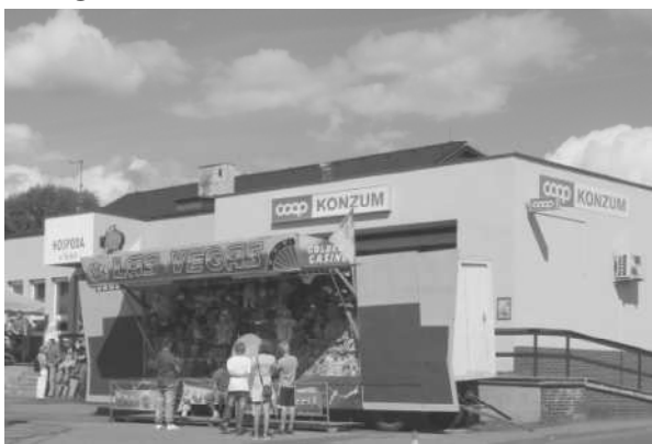
(Peníze z LAS VEGAS rovnou do KONZUMU !)

Dnes je jich téměř 1400 s různými názvy. Před tím se nakupovalo v samoobsluhách. U nás začal samoobslužný prodej v roce 1955. Na pražském Žižkově, kde v červnu otevřeli úplně první samoobsluhu u nás. I přes počáteční nedůvěru si zákazníci prodej z regálů do košíčků časem oblíbili. Tam, kde dříve nebyl stálý obchod, dojížděly pojezdny prodejny. V osmdesátých letech jich po venkově jezdilo víc jak šest set. Dřív než se nakupovalo v samoobsluhách nebo pojezdných prodejních patřil maloobchod hokynářům a drobným obchodníkům. V malých obchůdkách bylo k dostání téměř vše co bylo nutné k životu. Ve velkých městech se po vzoru evropských velkoměst začaly budovat obchodní domy. K nejznámějším u nás patřila BÍLÁ LABUŤ v Praze, která byla otevřena již v roce 1939. Tento obchodní dům patřil proslulé obchodní společnosti BROUK a BABKA. Velké obchodní domy začaly ve větší míře vyrůstat až v šedesátých letech. Byly po například PRIOR a KOTVA. Objevil se také zásilkový prodej MAGNET.