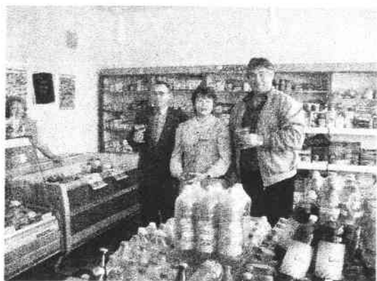
slavnostní připítek při otevření prodejny

1. 4. 1960 bylo založeno jedno Lidové spotřební družstvo Klatovy se sídlem v Sušici. Mělo 380 prodejen, 314 pohostinských provozoven a 1275 zaměstnanců. V té době také vznikl slogan „Zboží z Jednoty do každé samoty“. Formou „Akce Z“ se začaly postupně stavět další prodejny. Bylo tomu