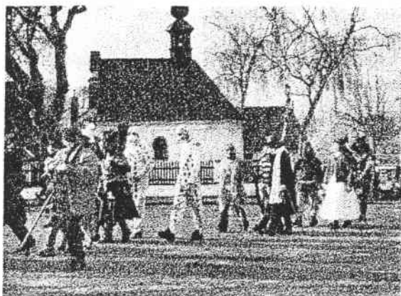
Masopustní průvod z minulého roku

V sobotu 1. března ve 14 hodin vyjde z Kulturního domu tradiční masopustní průvod. Jak stará je tradice masopustních průvodů v naší vesnici nevíme. Jisté je, že „obchůzka maškar“ má v naší obci mnohaleté kořeny. A hlavně, že se od skončení druhé světové války ve Svěradicích zachovala nepřetržitě. Bohatá fotodokumentace