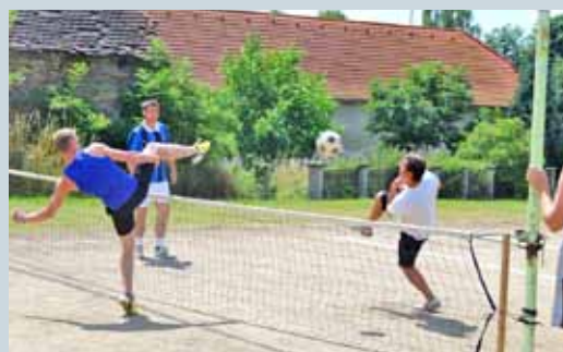
NOHEJBALOVÝ TURNAJ TROJIC