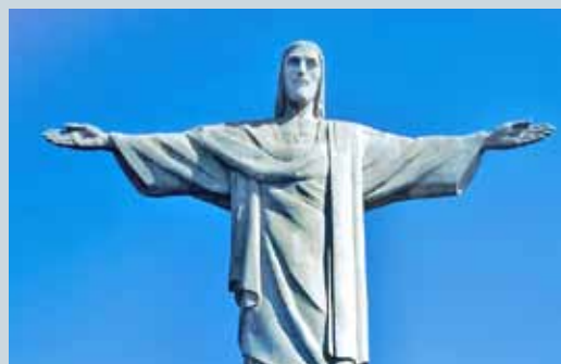
„ZDE NA VŠECHNO DOHLÍŽÍ KRISTUS SPASITEL“ ANEB OD RIA AŽ DO SVĚRADIC