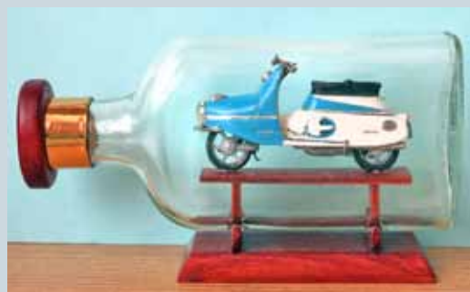
POUŤOVÝ PROGRAM 2016