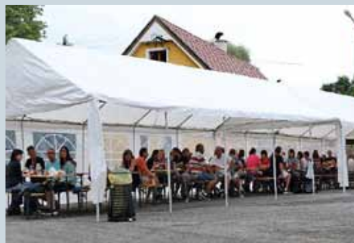
SVĚRADICKÉ PIVNÍ SLAVNOSTI