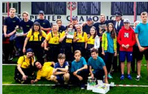
SDH SVĚRADICE – ČINNOST V ROCE 2019