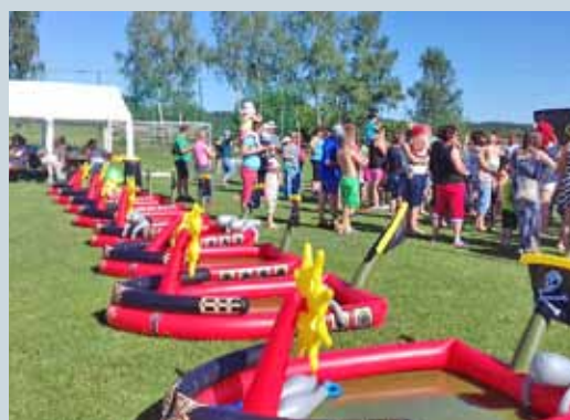
DĚTSKÝ DEN – ROZLOUČENÍ SE ŠKOLNÍM ROKEM str. 5