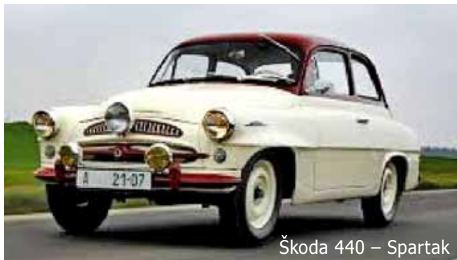
Škoda 440 – Spartak

Události roku 1968 mapuje naše kronika pouze jedinou stránkou a o vpádu okupačních vojsk je pouze tato zmínka: „21. srpna se dostavila na území našeho státu vojska Varšavské smlouvy.“ O samotném dění v obci pak informují pouze dvě věty: „Poutová oslava se v tomto roce nekonala.“ „Pokračovalo se ve výstavbě bytové jednotky poblíž školy.“