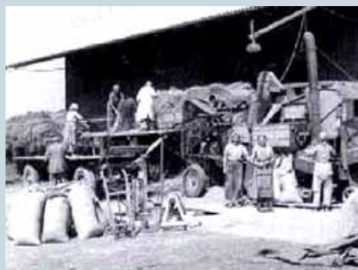
VÝMLAT NA ZKOUŠKU str. 10