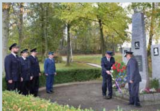
OSLAVY 100 LET ČESKOSLOVENSKA