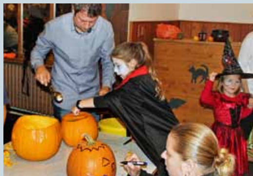
PODZIM S PACIENTY