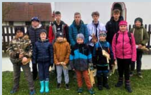
LETOŠNÍ VELIKONOČNÍ KRÍSTÁNÍ