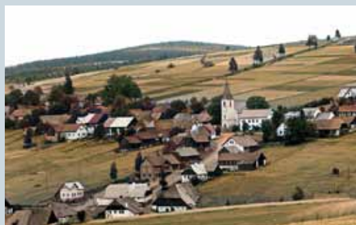
O ZHŮŘÍ (HAIDL, MÍSTNÍM NÁŘEČÍM HOIL) NA ŠUMAVĚ