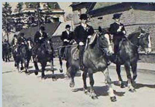
HISTORIE VELIKONOC, TRADICE, ZVYKY A SYMBOLY