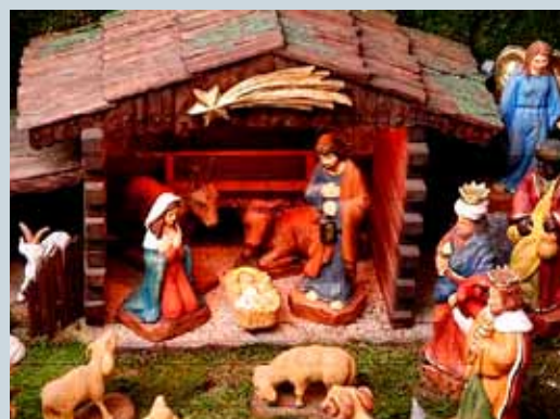
VÁNOCE A JEJICH TRADICE