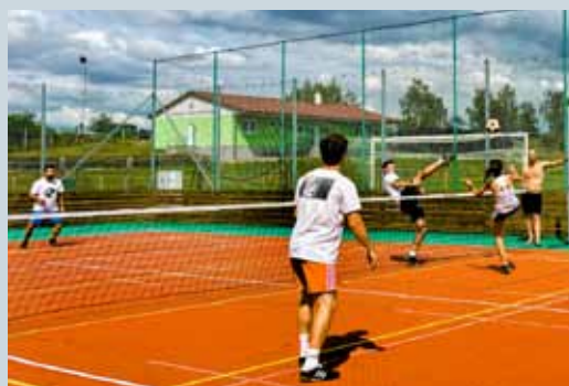
NOHEJBALOVÝ TURNAJ TROJIC