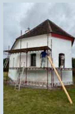
REKONSTRUKCE FASÁDY KAPLE SVATÉHO BARTOLOMĚJE