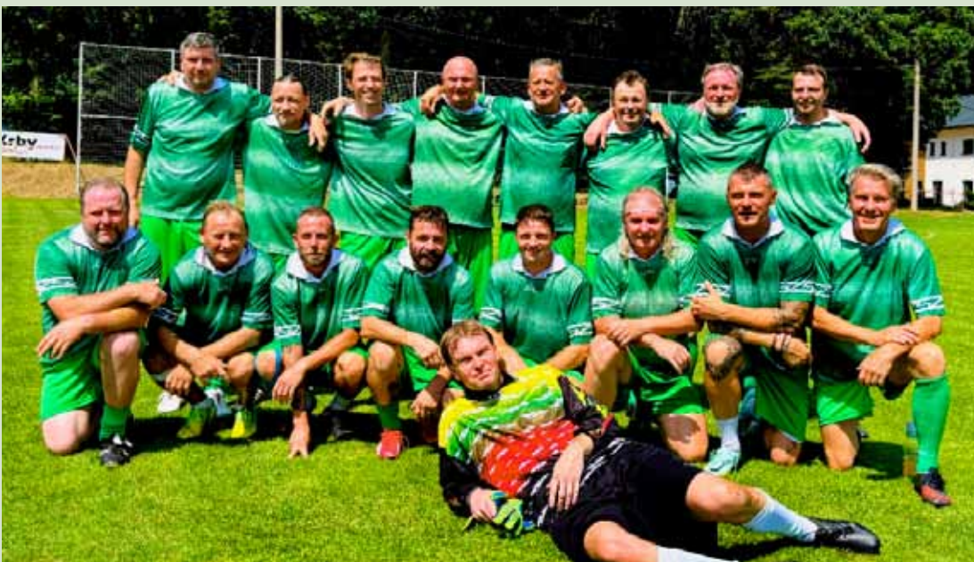
Vítězný tým turnaje – stará garda FK Svěradice

Příští ročník Memoriálu Františka Pavlovského a Josefa Smitky proběhne v roce 2025 opět v Chanovicích, protože předcházející dva ročníky 2022 a 2023 se uskutečnily ve Svěradicích. vd