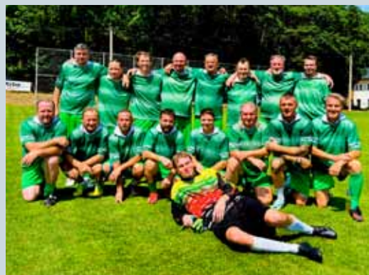
MEMORIÁL FRANTIŠKA PAVLOVSKÉHO A JOSEFA SMITKY