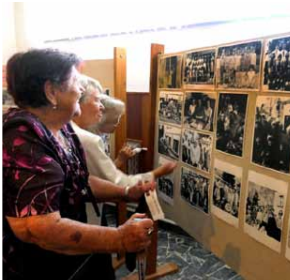
Malá výstava fotografií z historie školy