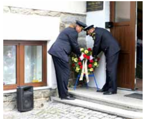
Položení věnce u pamětní desky