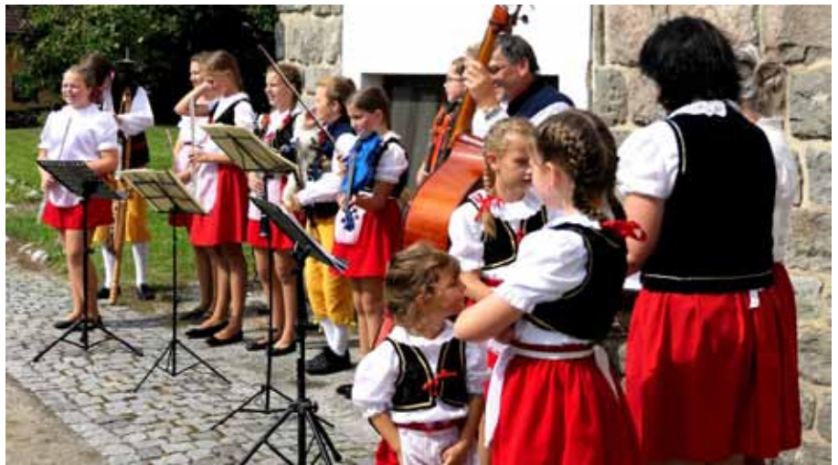
Dětský sbor Pšeničky