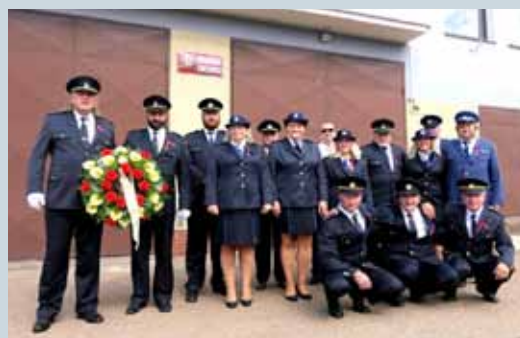
SETKÁNÍ RODÁKŮ A OBČANŮ SVĚRADIC – ČLENOVÉ HASIČSKÉHO SBORU PŘED ODCHODEM DO ŠKOLY