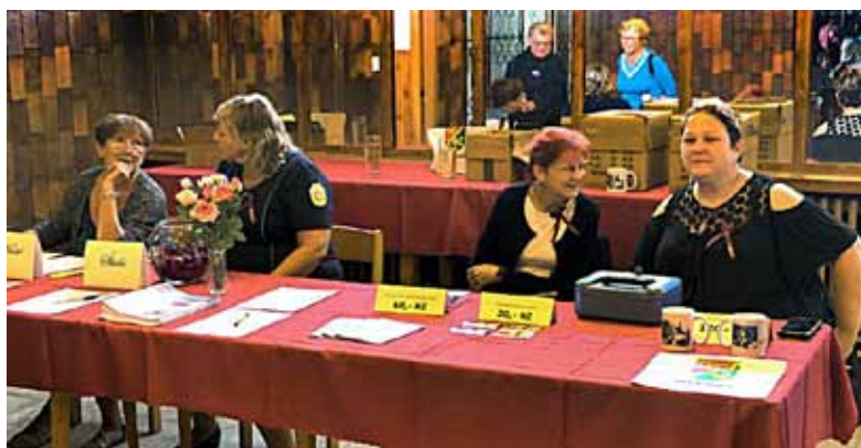
U vstupu bylo možné si zakoupit propagační předměty