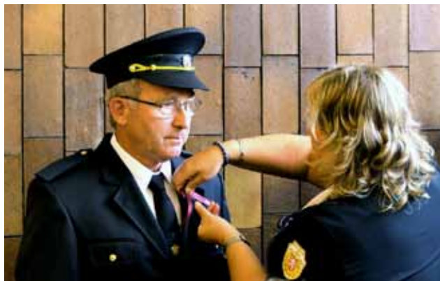
Rodáci obrželi památeční mašličky