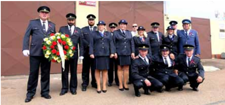
Členové hasičského sboru před odchodem do školy

Je dobře, že tou nejpočetnější skupinou jsou občané, kteří se přišli zaregistrovat, naobědvali se, pak se přesunuli do areálu školy a pak zase zpět do KD. Prostě absolvovali celý program nebo z různých důvodů alespoň jeho část. Byla možnost zhlédnout čtyři různá vystoupení sborů či kapel, a to z různých soudků zábavy. Každý si mohl vybrat to, co se mu líbí, a proto byla účast na jednotlivých produkcích proměnlivá. To se dá pochopit a je to zcela normální. ▶