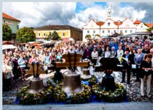
ZVONY PRO ŠUMAVU