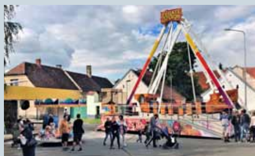
BARTOLOMĚJSKÁ POUŤ PROBĚHLA O POSLEDNÍM SRPNOVÉM VÍKENDU