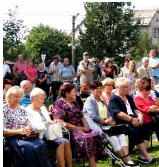
Hosté sledují program před budovou školy