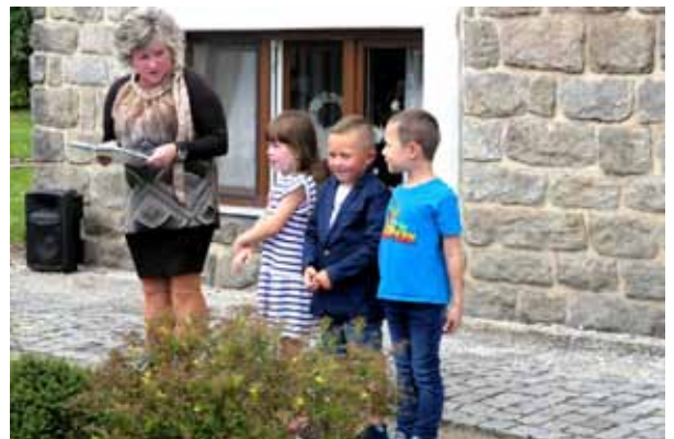
Krátká besídka dětí z MŠ