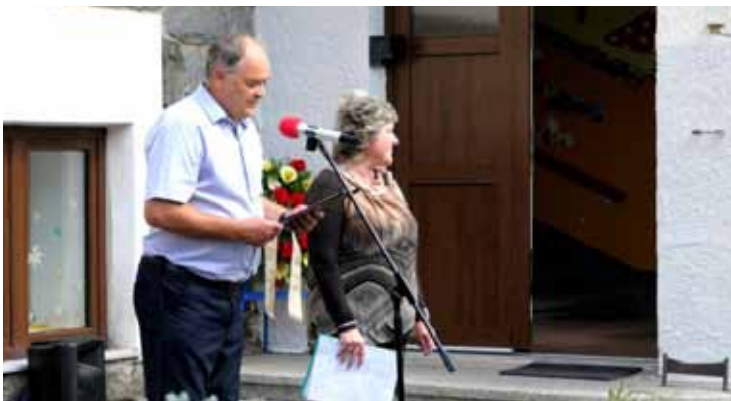
Projev starosty a ředitelky MŠ