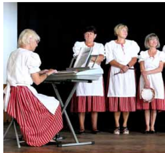
Babský sbor z Dolního Poříčí

V programu pak přišla řada na oblíbenou dechovou hudbu ze Sušice – Solovačku –, která už u nás ve Svěradicích několikrát vystupovala. Tato kapela byla vybrána hlavně z toho důvodu, aby starší rodáci i starší občané naší obce si mohli zazpívat a zatančit na známé lidové písně. Právě na toto vystoupení mělo podle našich předpokladů přijít nejvíce účastníků