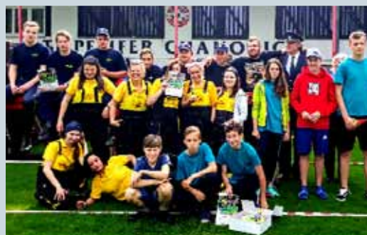
SDH SVĚRADICE – ČINNOST V ROCE 2019