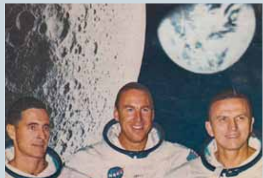
21. ČERVENCE 1969: PRVNÍ ČLOVĚK NA MĚSÍCI