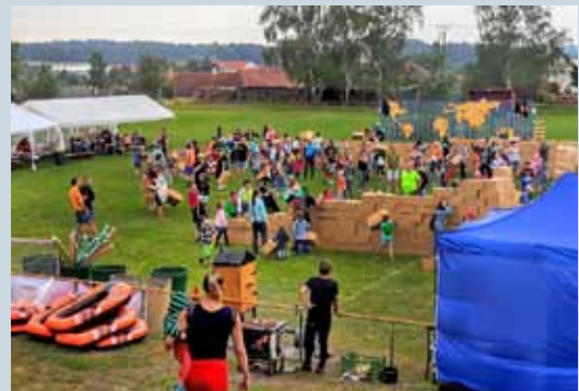
DĚTSKÝ DEN 22. ČERVNA