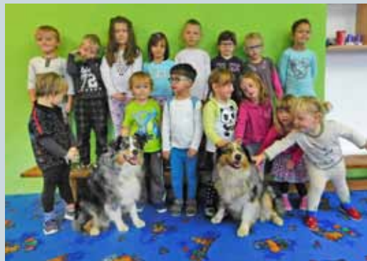
PODZIM A ADVENT VE ŠKOLCE