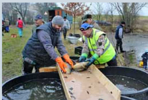
SVĚRADICKÁ RYBA 2017