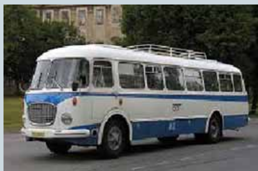
NÁVRAT KRAJSKÉ AUTOBUSOVÉ DOPRAVY? str. 12