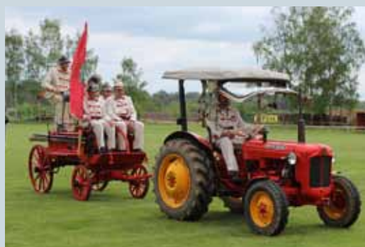
OKRSKOVÁ HASIČSKÁ SOUTĚŽ 2017