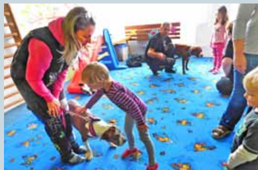
HURÁ DO ŠKOLY