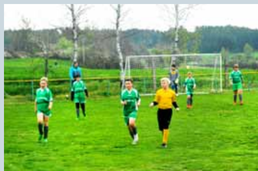
ÚVOD PODZIMNÍ SEZÓNY