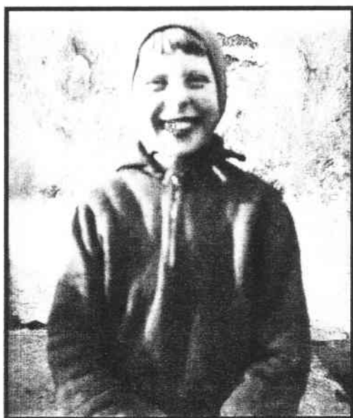
Hanička z thrilleru JÓ TY DĚTI

termín voleb je citován na titulní straně našich novin starostou obce a je 15. a 16. října 2010 zdroj INTERNET připravil mot