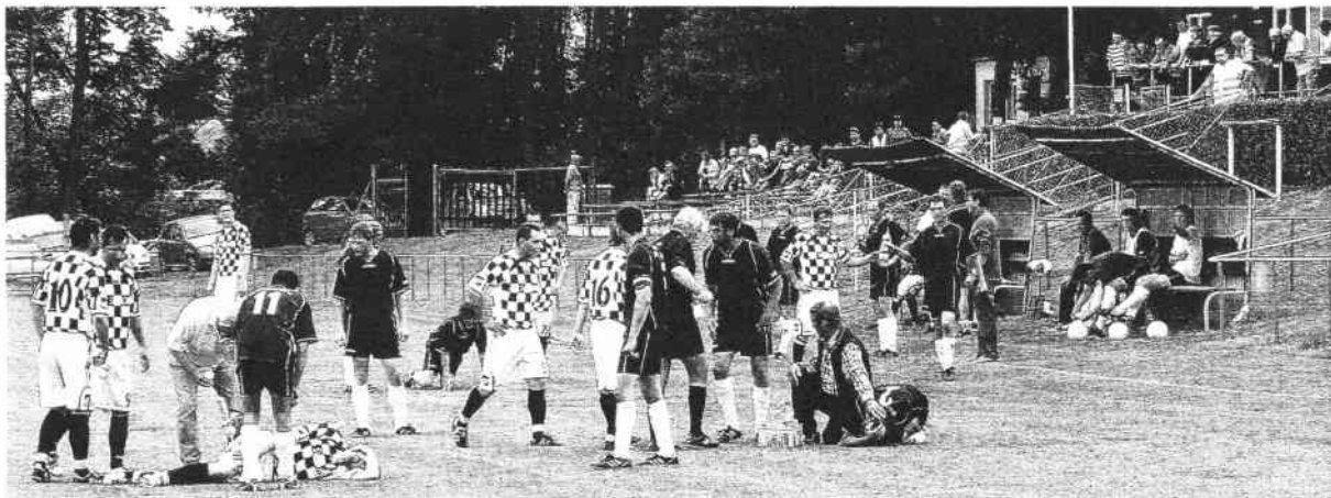
hromadná srážka několika hráčů v předposledním utkání foto mot

B mužstvo hrálo okresní soutěž IV. třídy skupiny „B“. A naši žáci hráli krajskou soutěž skupiny „B“.