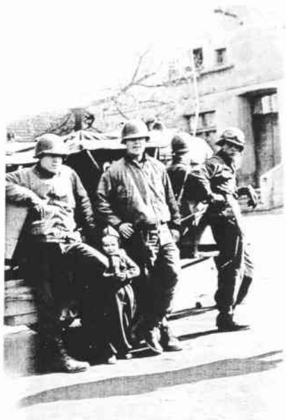
Před hospodou „U Zoubků“

Za pár dnů vzpomeneme již 59. výročí osvobození západních a jižních Čech americkou armádou, které na našem území velel legendární generál Patton. V dnešní fotokronice si tyto dny připomeneme. Stále mezi námi žije hodně těch, kteří na tyto chvíle vzpomínají, ale již více je těch, kteří o těchto historických okamžicích slyší již jen z vyprávění.