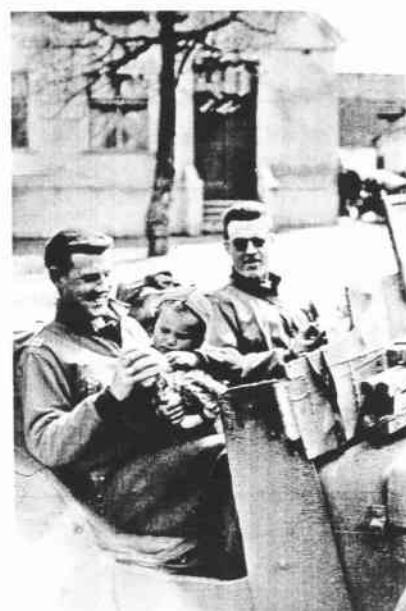
Fešáci US - Army