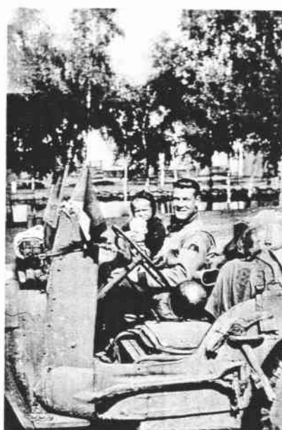
Vojáci milovali malé děti