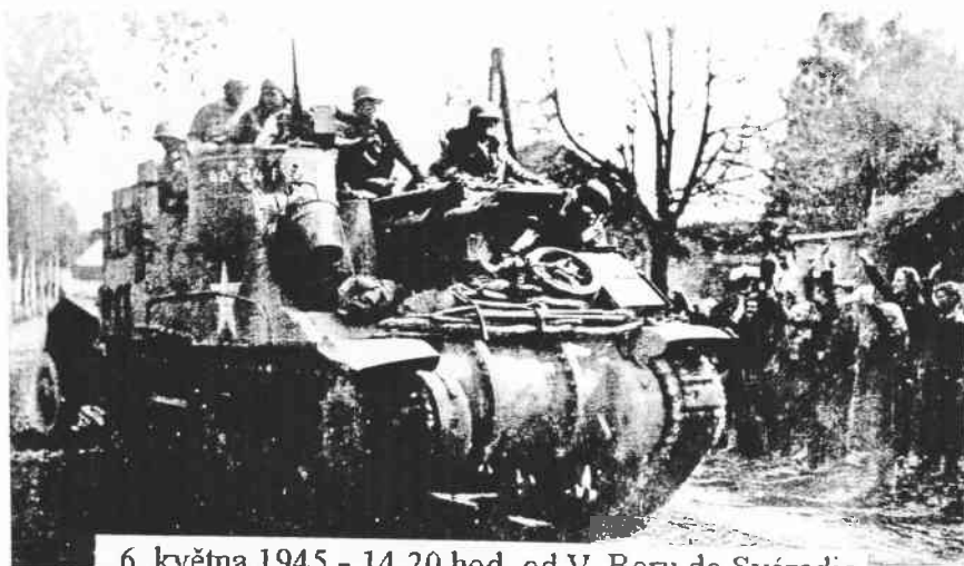
6. května 1945 - 14.20 hod od V. Boru do Svěradic přijíždí první americké tanky

Za pár dnů vzpomeneme již 59. výročí osvobození západních a jižních Čech americkou armádou, které na našem území velel legendární generál Patton. V dnešní fotokronice si tyto dny připomeneme. Stále mezi námi žije hodně těch, kteří na tyto chvíle vzpomínají, ale již více je těch, kteří o těchto historických okamžicích slyší již jen z vyprávění.