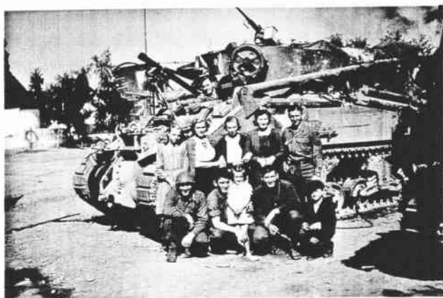
Děvčata z Holkovic s americkými vojáky na svěradické návsi