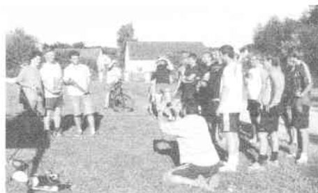
Horažďovice Jouza tým