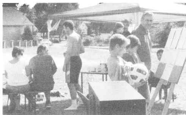
Vítězný BERY tým Svěradice