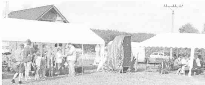
předávání odměn mladým Slatičanům starostou obce mot