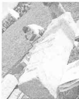
Dokončovací práce na díle

symboly vytesanými do žulových hranolů. Malého sochařského symposia se zúčastnilo několik pozvaných dospělých opracovatelů kamene, práci s kamenem si vyzkoušeli i mladí ze Slatiny.