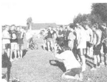
Horažďovice Šunky tým