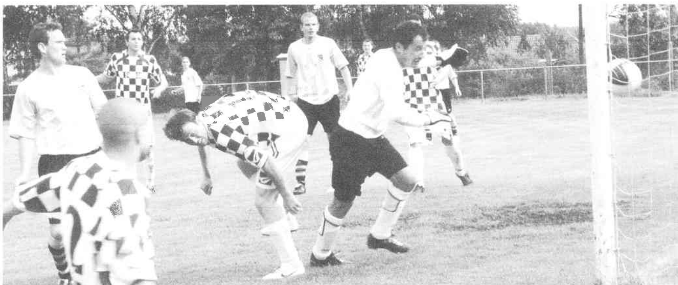
gól domácích v úvodním zápase s Doubravicí ( Svěradice vyhrály 2:0 )

5. července 2011 se konal na hřišti ve Svěradicích 8. ročník memoriálu F. Kozlíka - turnaj starých gard nad 35 let ve fotbale. Zúčastnili se fotbalisté z Doubravice, Horažďovic, Hrádku u Sušice a pořádajících Svěradic. Po vylosování mužstev, která proti sobě nastoupí v boji o finále, na sebe narazili hráči favorizované Doubravice a domácích Svěradic, dále potom Horažďovic a Hrádku. Svěradičtí proti Doubravici bojovali a po výhře 2:1 se dostali do finále. Ve druhém zápase Hrádek přehrál Horažďovice 4:1. Následoval souboj o třetí místo v turnaji, které si vybojovala Doubravice výsledkem 10:2 s Horažďovicemi. Ve finále hráči Svěradic nestačili na dobře hrající starou gardu z Hrádku a po prohře 0:3 obsadili konečné druhé místo. Vítězem turnaje se po zásluze stali hráči Hrádku. Nejlepším brankářem turnaje byl vyhlášen brankář Hrádku Kutil, nejlepším střelcem se 6 góly hráč Doubravice Roučka a nejlepším hráčem M. Jiřinec ze Svěradic. Svěradičtí fotbalisté ve spolupráci s obcí Svěradice uspořádali turnaj, který se vydařil. P. Löffelmann